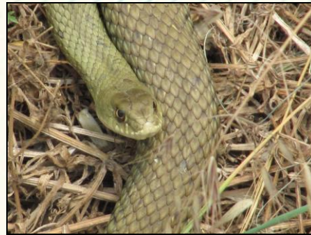
Foto 1. Per Alexandre Roux (CC BY-NC-SA 2.0) via https://www.flickr.com/search/?l=deriv&q=malpolon%20monspessulanus Foto 2. Serp verda a la llera del riu Congost en la zona de Palou (Ajuntament de Granollers)

Hàbitat i ecologia: Típica mediterrània, habita a zones de matollar, espais oberts i zones antropitzades com ara cultius i construccions.