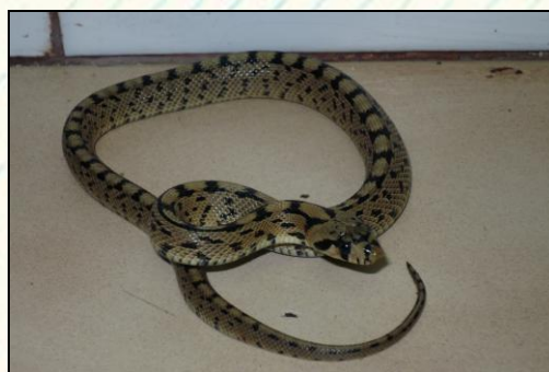
Foto 1 Adult.

Foto 2 Jove.