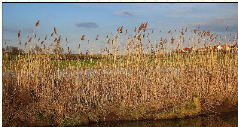
Foto 1.